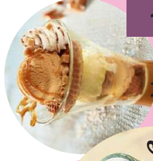
Caramel beurre salé